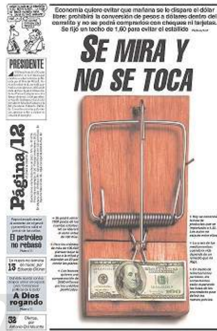
Figuras 5 y 6. Portadas del 6/12/2001 y del 8/1/2002 respectivamente.

El último tipo de imagen al que haremos referencia es la foto directa de intervención, en la que existe, como en el fotomontaje, una manipulación en el proceso de creación. Sin embargo, ambas manipulaciones varían en el modo en que se ha creado la imagen: en el primer caso existe una puesta en escena en el momento de la toma mientras que en el segundo caso se realiza una edición digital con imágenes ya existentes. Un ejemplo de foto directa de intervención es la publicada el 4/12/2001, en relación a la medida de limitar la extracción de dinero de los bancos (ver Figura 7). Una de las consecuencias más evidentes de esta decisión fue la “palpable inactividad en la mayoría de los negocios”, la cual es representada ocurrentemente por Página/12 , con el fin de causar sorpresa y divertir.