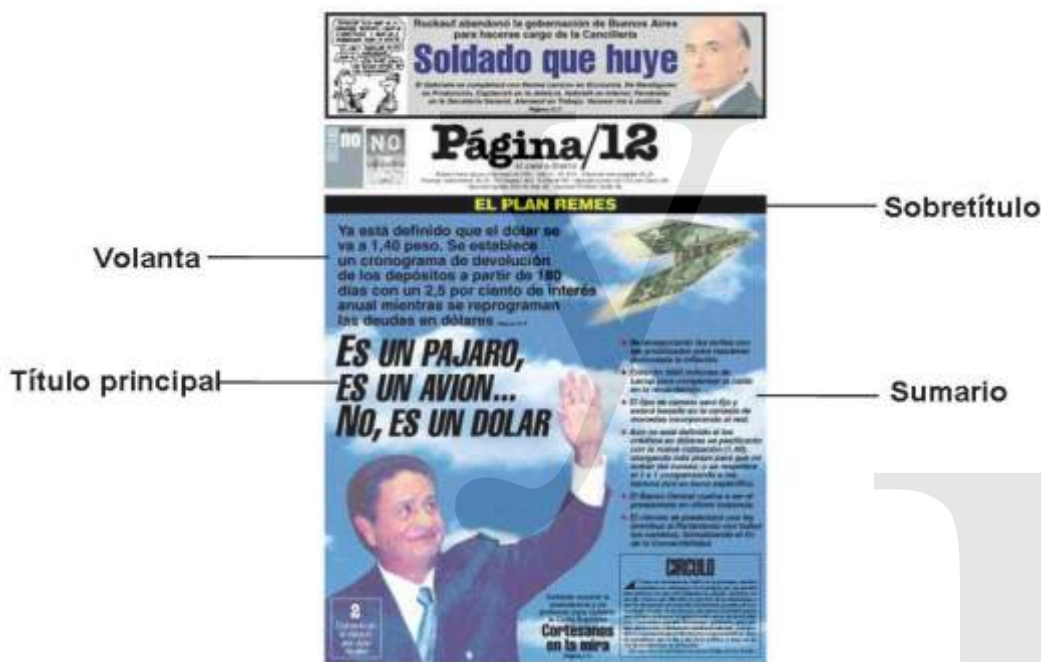
Figura 1. Titulación utilizada en la portada de Página/12 .

La maqueta del diario, que sigue un estilo predefinido y estable a lo largo del tiempo, determina la distribución del texto escrito y la imagen en la portada, y la manera en la que éstos estarán relacionados. El texto escrito que constituye nuestro objeto de estudio es la titulación - titulares que encabezan el cuerpo de la noticia-, que puede estar compuesta por un sobretítulo, una volanta, un título principal y un sumario (ver Figura 1). Siguiendo a Ambort et al (1996), distinguimos el sobretítulo de la volanta por el hecho de que el primero suele ser más breve y está destinado generalmente a situar geográfica o temáticamente una noticia, aunque el uso que de él hace Página/12 es bastante laxo. Con respecto a las diferencias entre subtítulo y sumario, si el primero suele consistir en una única oración que presenta alguna información en particular que se desea resaltar, el sumario está compuesto por varias oraciones que abordan informaciones diferentes de la noticia.