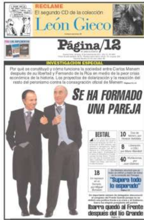
Figuras 16 y 17. Portadas del 8/12/2001 y del 16/12/2001 respectivamente.

Entre las figuras retóricas visuales, la más habitual es la metáfora, a partir de la cual se establece una analogía entre dos ideas o personas como el hecho de presentar al presidente De la Rúa y al ministro Cavallo como indigentes (ver Figura 5). El símbolo, por su parte, es un recurso de gran utilidad para condensar sintéticamente —a través de un signo— una idea abstracta, consensuada culturalmente, tal el caso de la V de victoria. Las cacerolas, presentes en numerosas fotografías de actualidad, también pueden ser consideradas como un símbolo, que representa un tipo particular de protesta social pacífica.