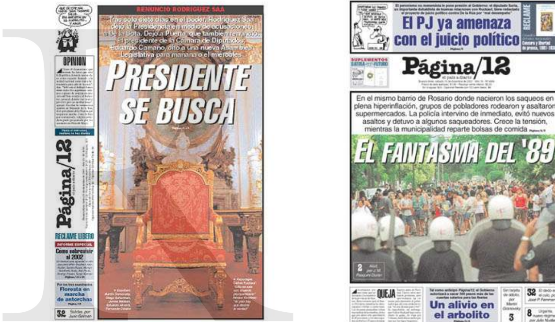
Figuras 14 y 15. Portadas del 31/12/2001 y del 15/12/2001 respectivamente.

Los tres tipos de referencias a un patrimonio cultural que hemos desarrollado dejan clara la capacidad que tienen particularmente los títulos de insertarse socialmente en un grupo dado, excluyendo del mismo aquellos que no dispongan de las competencias necesarias para su interpretación. Este trabajo de intertextualidad exige mucho del lector, quien debe asumir un rol activo y poner en juego una gran diversidad de conocimientos, una “hiper-competencia”, siguiendo la clasificación de Kerbrat-Orecchioni (1986) para casos más generales. Esta hiper-competencia integra como mínimo cuatro competencias principales: lingüística (a la que agregamos la ícono-plástica), enciclopédica (la actualización de un bagaje cultural amplio), lógica y retórico-pragmática (con el uso de figuras retóricas, por ejemplo). A través de estos juegos intertextuales, Página/12 instauro una mirada particular sobre los hechos de actualidad, y establece un vínculo más estrecho con el lector.