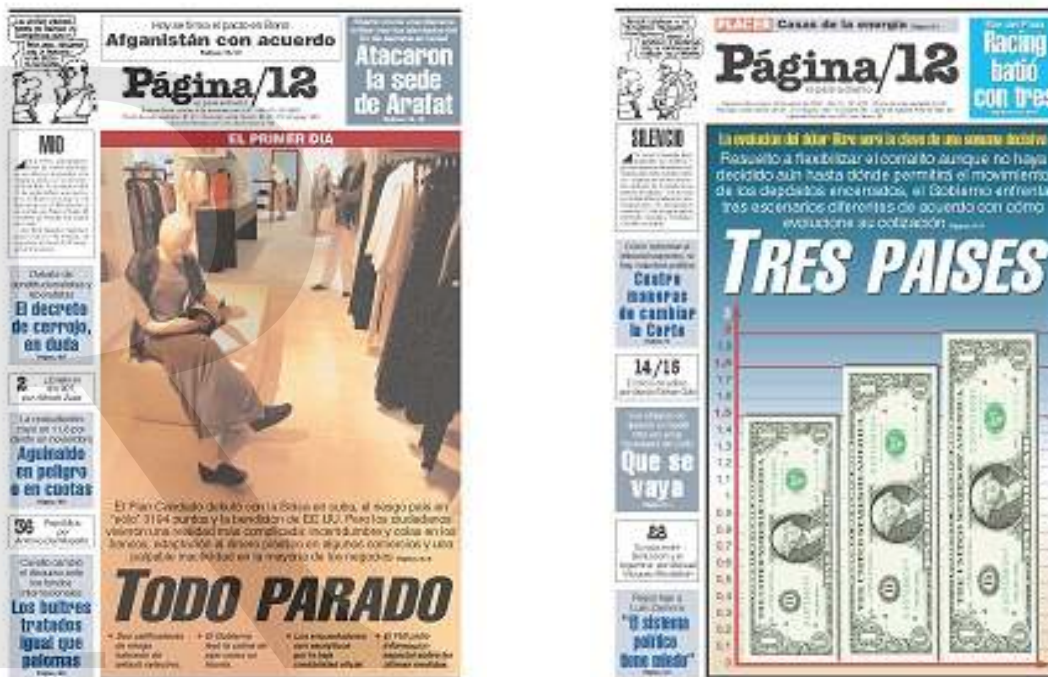
Figuras 7 y 8. Portadas del 4/12/2001 y del 14/1/2002 respectivamente.