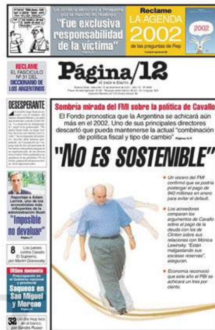
Figuras 12 y 13. Portadas del 11/12/2001 y del 19/12/2001 respectivamente.

Con respecto a la relación de contradicción entre el título y la imagen, un ejemplo es la portada del 11/12/2001 (ver Figura 12), en la cual se abordan las medidas del Ministro Domingo Cavallo en su intento por obtener el apoyo del Fondo Monetario Internacional. La imagen, que es un fotomontaje, nos muestra al funcionario en primer plano, serio, de perfil, vestido de traje y sentado sólo en una butaca del estadio de Racing Club, el cual está completamente vacío. El efecto de soledad que se busca atribuir al personaje se ve incrementado por la utilización de un gran angular y del plano contra-picado, los cuales aumentan la profundidad de campo y la perspectiva. Ahora bien, ¿por qué se eligió un estadio de fútbol para representar la escena? La respuesta se obtiene, como es habitual, en relación con la titulación. Un estadio evoca generalmente la pasión de la masa, que se une en sentimiento para alentar a su equipo. Esta idea entra en contradicción con el título principal, un claro ejemplo de antífrasis. 3 La oposición de ideas se obtiene también entre el título, el sobretítulo y la volanta, estos dos últimos