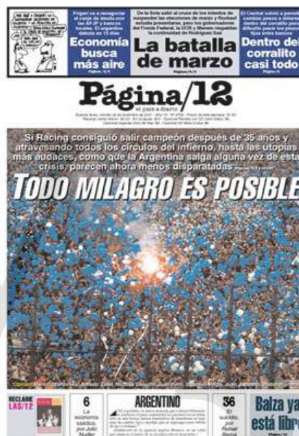
Figuras 10 y 11. Portadas del 22/12/2001 y del 28/12/2001 respectivamente.

Además de la complementariedad, hemos detectado casos en los que lo verbal ancla lo visual (25%) como así también casos de contradicción (6%). Un ejemplo de anclaje es la Figura 11. La fotografía de actualidad muestra un estadio repleto de seguidores del equipo argentino de fútbol Racing Club de Avellaneda, cuyos colores son el celeste y el blanco, al igual que la bandera nacional. El título principal hace referencia al triunfo de este equipo en el Campeonato de Fútbol de Apertura, luego de 35 años. Página/12 presenta este acontecimiento como “un