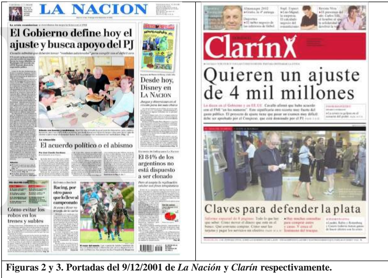
Figuras 2 y 3. Portadas del 9/12/2001 de La Nación y Clarín respectivamente.